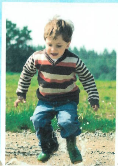
ігри на свіжому повітрі