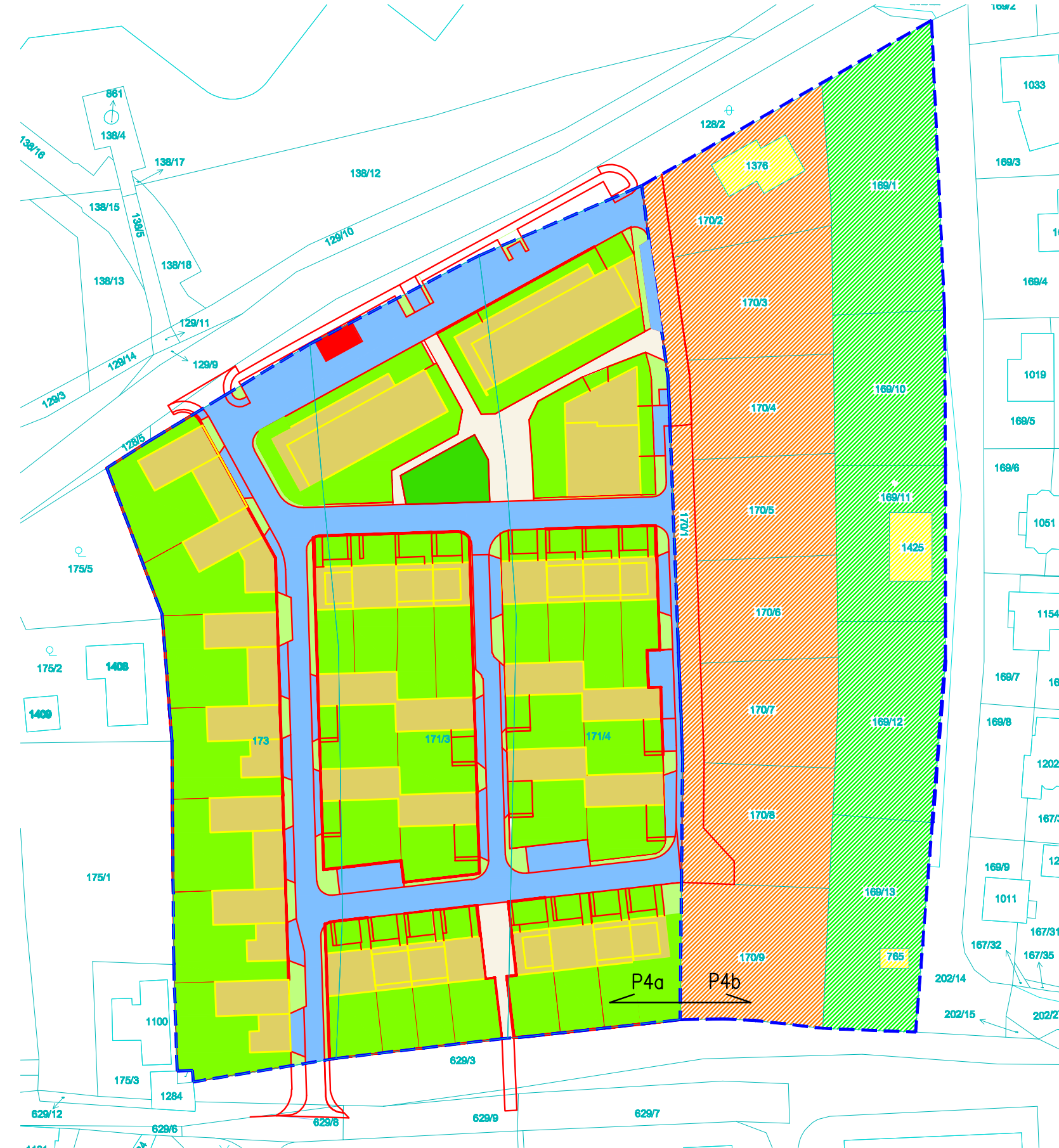
ZÁKRES VYNĚTÍ ZE ZPF 1:1000