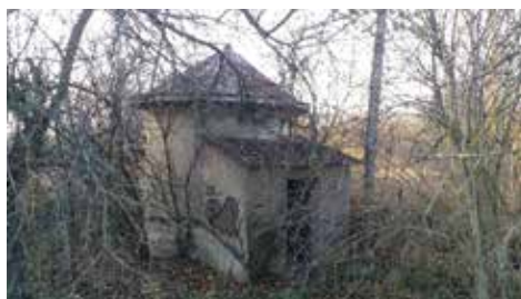
Aktuální stav v mokřadu