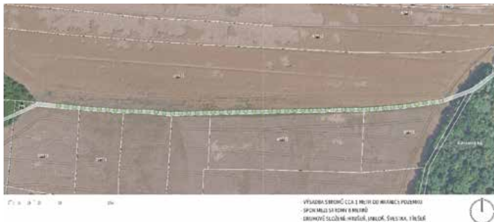
Alej nad lomem

Opět připomínám, že stromy raději sázíme, než kácíme, proto v posledních dnech došlo a stále dochází i k rozsáhlým výsadbám. Alej, která původně měla vést pouze k čerpací stanici Hrubý, jsme protáhli i na Zdibsko ke statku. Další alej vznikne nad lomem. Zde město vlastní uprostřed pole starou cestu, která však byla v minulosti rozorána a stala se součástí velkého lánu. Město se svůj pozemek rozhodlo využít k vytvoření meze s alejí ovocných stromů. Toto opatření přispívá ke zmenšení půdní eroze a udržení vody v krajině. Další stromy budeme vysazovat na místě pokácených topolů u fotbalového hřiště a podél hřbitova. Přestárlé stromy v havarijním stavu zde budou nahrazeny novou výsadbou.